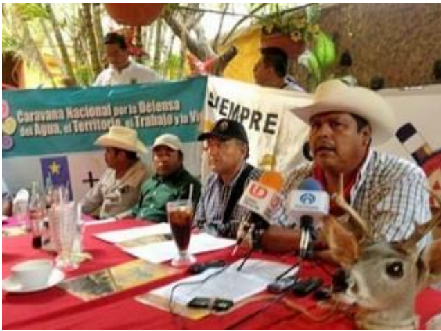
Imagen de la dirigencia del movimiento, en conferencia de prensa ofrecida durante su recorrido por el país