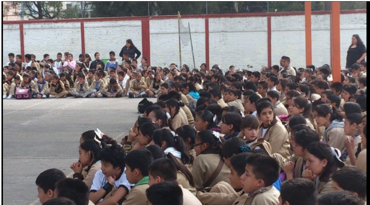
Alumnos de la EST No. 16 en la delegación Gustavo A. Madero, presencian una plática de la Policía Federal.

México, DF. Diputados locales y federales del PRD se congratularon por el acuerdo de coordinación que firmaron el jefe de Gobierno del Distrito Federal, Miguel Ángel Mancera, los 16 jefes delegacionales y el titular de la SEP, Emilio Chuayffet Chemor, para invertir 640 millones de pesos en el mejoramiento de la infraestructura educativa en la ciudad de México, lo cual beneficiará a cerca de 76 mil alumnos de nivel básico.